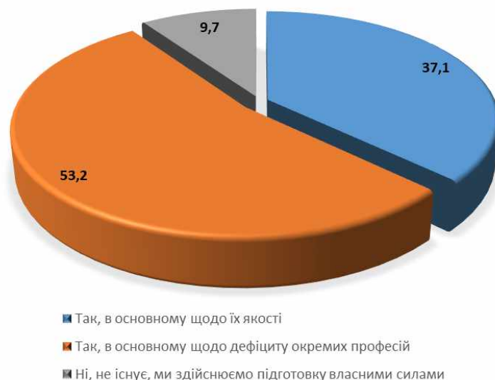
Рис. 3. Проблема дефіциту кваліфікованих кадрів та якості освіти випускників Уманського НУС на підприємствах (у відсотках)

На запитання "Чи існує проблема дефіциту та якості кваліфікованих кадрів на Вашому підприємстві у даний час?" 53,2% респондентів відповіли, що мають дефіцит кадрів окремих професій, 37,1% – мають питання по якості кваліфікованих кадрів та 9,7% здійснюють підготовку кадрів власними силами (рис. 3).