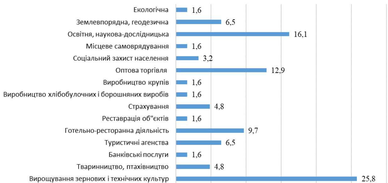
Рис.1. Основний вид діяльності потенційних роботодавців (у відсотках)

Опитування щодо відповідності якості навчання очікуванням роботодавців проводилося шляхом on-line анкетування. Учасниками опитування були роботодавці аграрної, готельно-ресторанної, туристичної, банківської, торгівельної, освітньої і науково-дослідницької, екологічної, земельної, страхової сфер. Всього опитано 62 респонденти за різними видами діяльності (рис. 1).