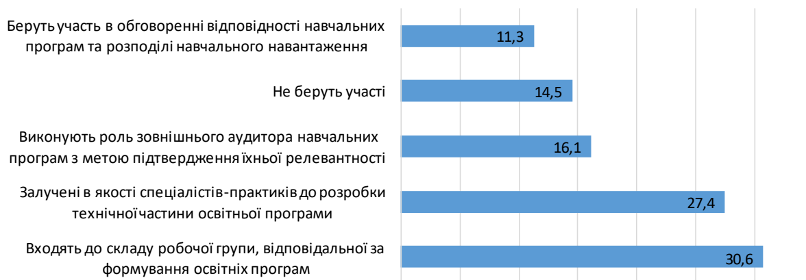
Рис. 6. Залучення представників роботодавців до формулювання цілей та програмних результатів освітніх програм (у відсотках)

На даний час 87,1% опитаних роботодавців співпрацюють з Уманським НУС у напрямку вдосконалення освітніх програм підготовки фахівців різних освітніх рівнів. Зокрема 30,3% входять до складу робочих груп, відповідальних за формування освітніх програм різних спеціальностей, 24,2% – активно залучаються як спеціалісти-практики, 21,2% – консультують при складанні навчальних програм по спеціальностях.