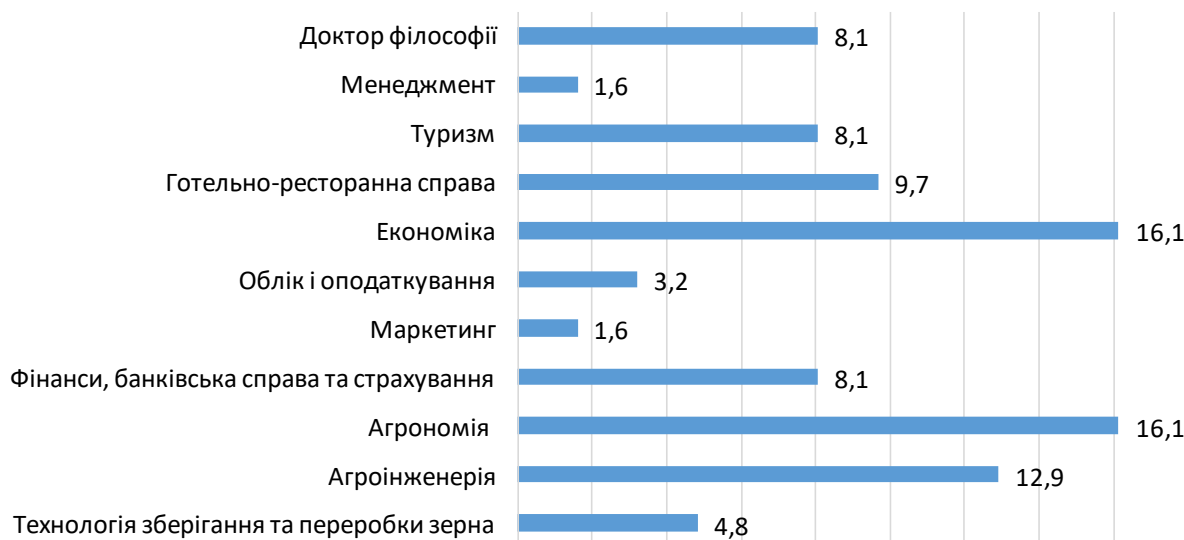
Рис. 5. Потреба підприємств у випускниках Уманського НУС у розрізі спеціальностей (у відсотках)

На даний час підприємства мають найбільшу потребу у випускниках таких спеціальностей: агрономія – 16,1%, економіка - 16,1%, агроінженерія – 12,9% та готельно-ресторанна справа – 9,7% (рис. 5).